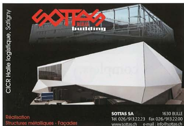
CICR Halle logistique, Satigny