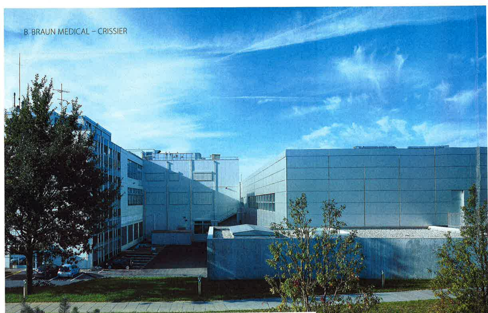
Les deux bâtiments se tiennent côte à côte. A gauche, l'ancienne construction. A droite, le rez de la nouvelle.