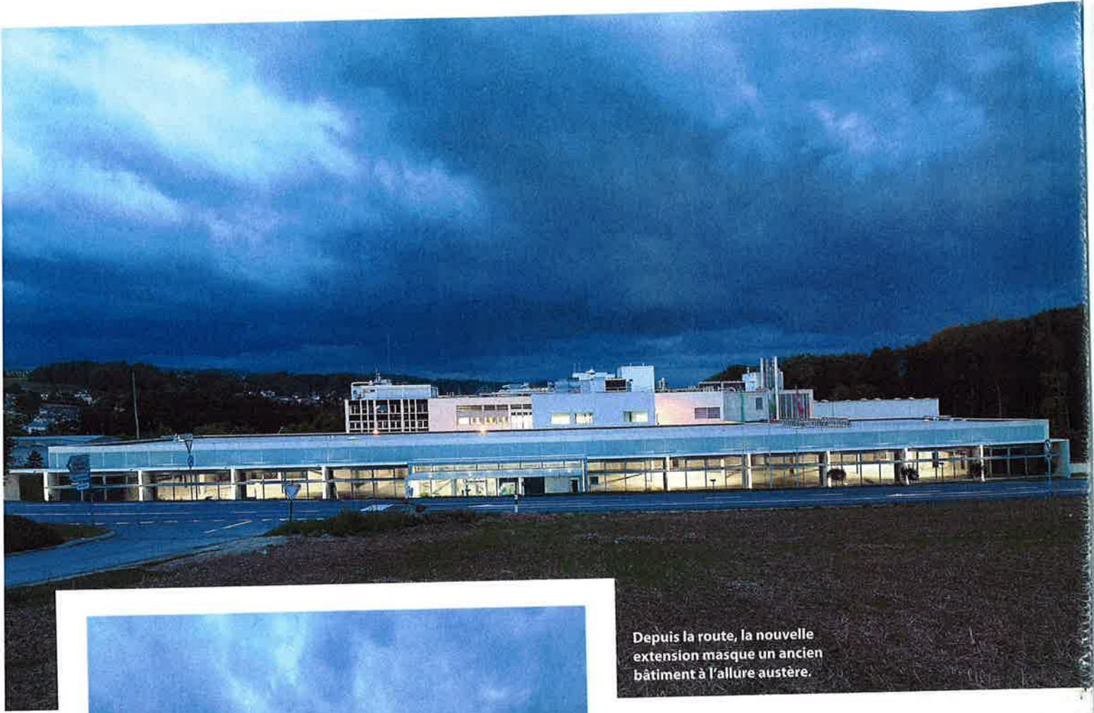
Depuis la route, la nouvelle extension masque un ancien bâtiment à l'allure austère.