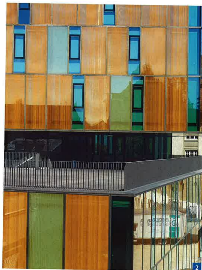
4 Volume émergeant au dessus de l'esplanade